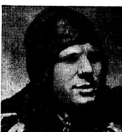
1958 год. Летчик.