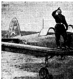
1954 год. Проба крыльев.