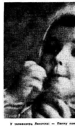
У телевизора Леночка: — Папку показываю...